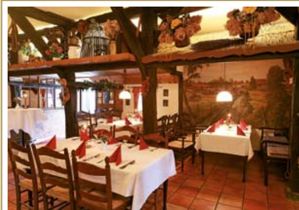
Die einladende Atmosphäre der Diele.

Nur für Gesellschaften nach Absprache geöffnet, keine regulären Öffnungszeiten.