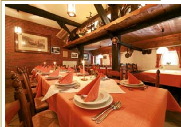
Tafelfreuden im Clubraum.